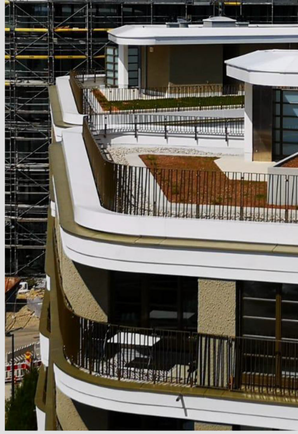
Referenzobjekte - Aluminiumfassade