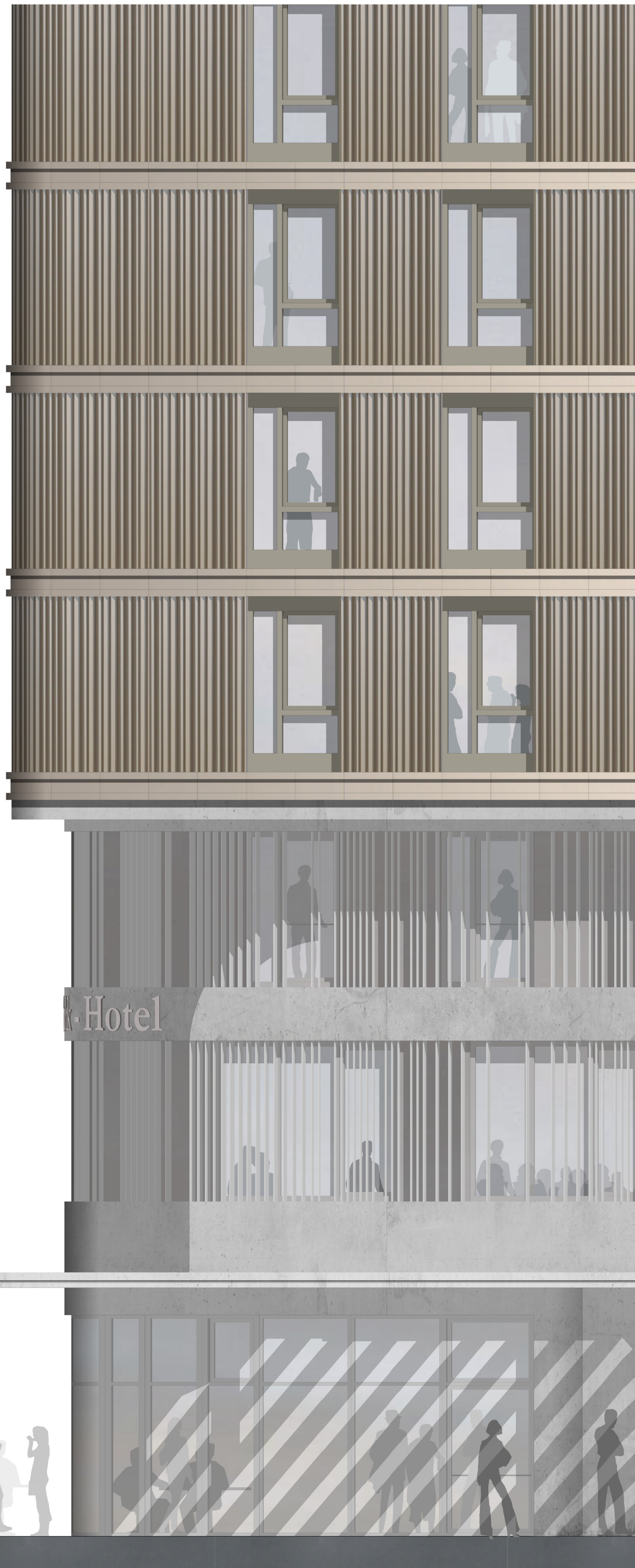
Ausschnitt Ansicht Nord M 1:25