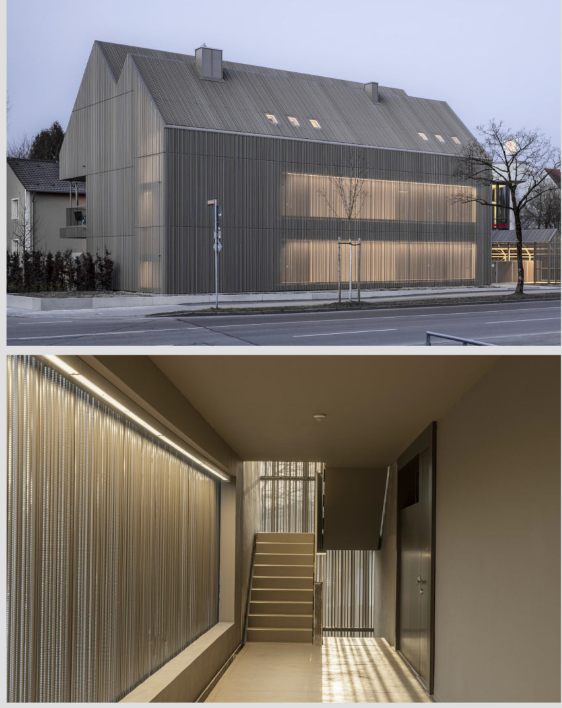
Materiälität - Perforierte Oberfläche